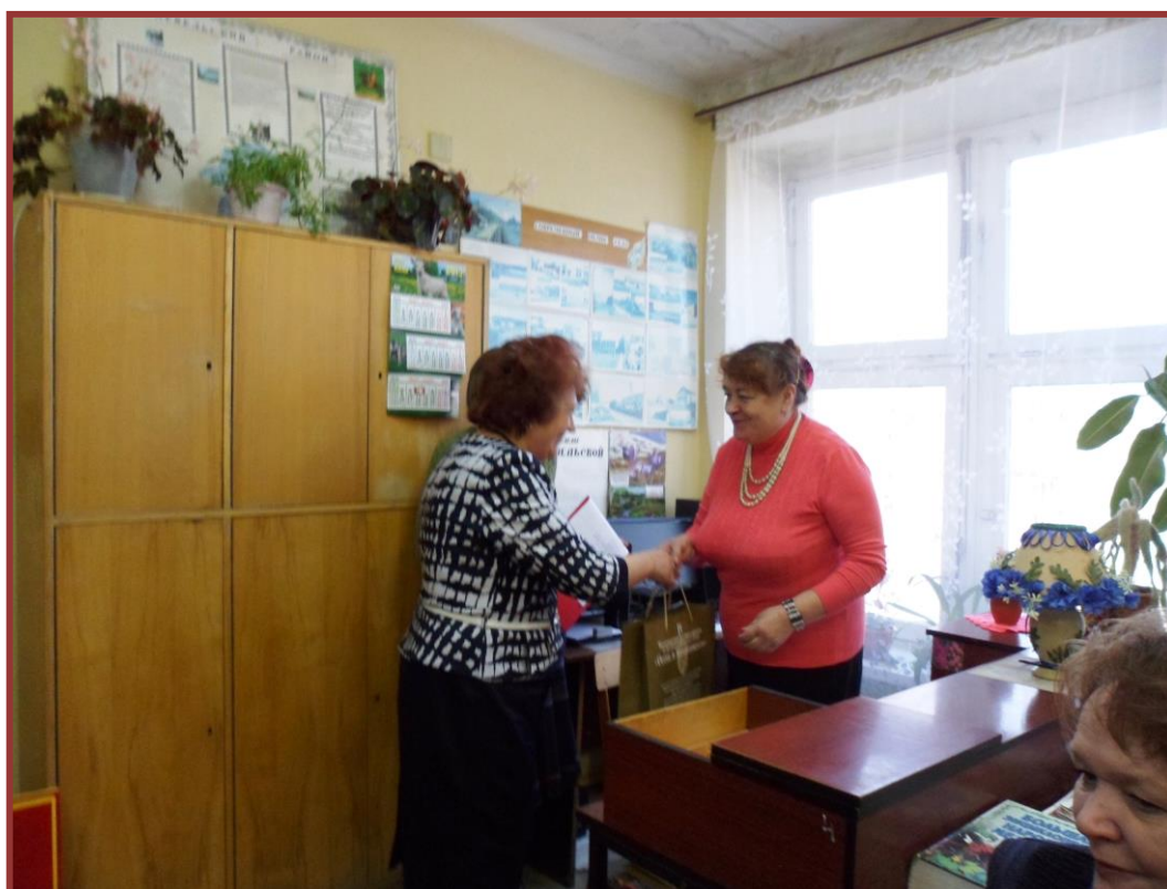
Фото: открытие Туричинской модельной библиотеки

В 2015 году библиотека участвовала в районном конкурсе «Библиотека - избирателям» среди библиотек МУК «Культура и досуг» по повышению правовой культуры избирателей и заняла первое место.