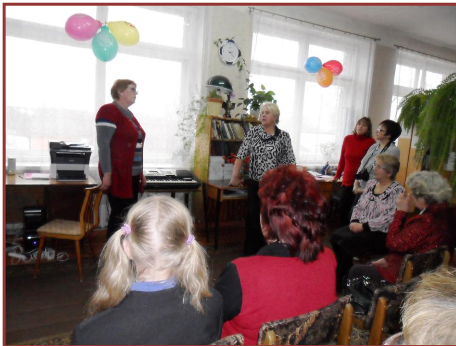
Фотографии: открытие Новохованской модельной библиотеки

В 2014 году библиотека отметила своё 90-летие.